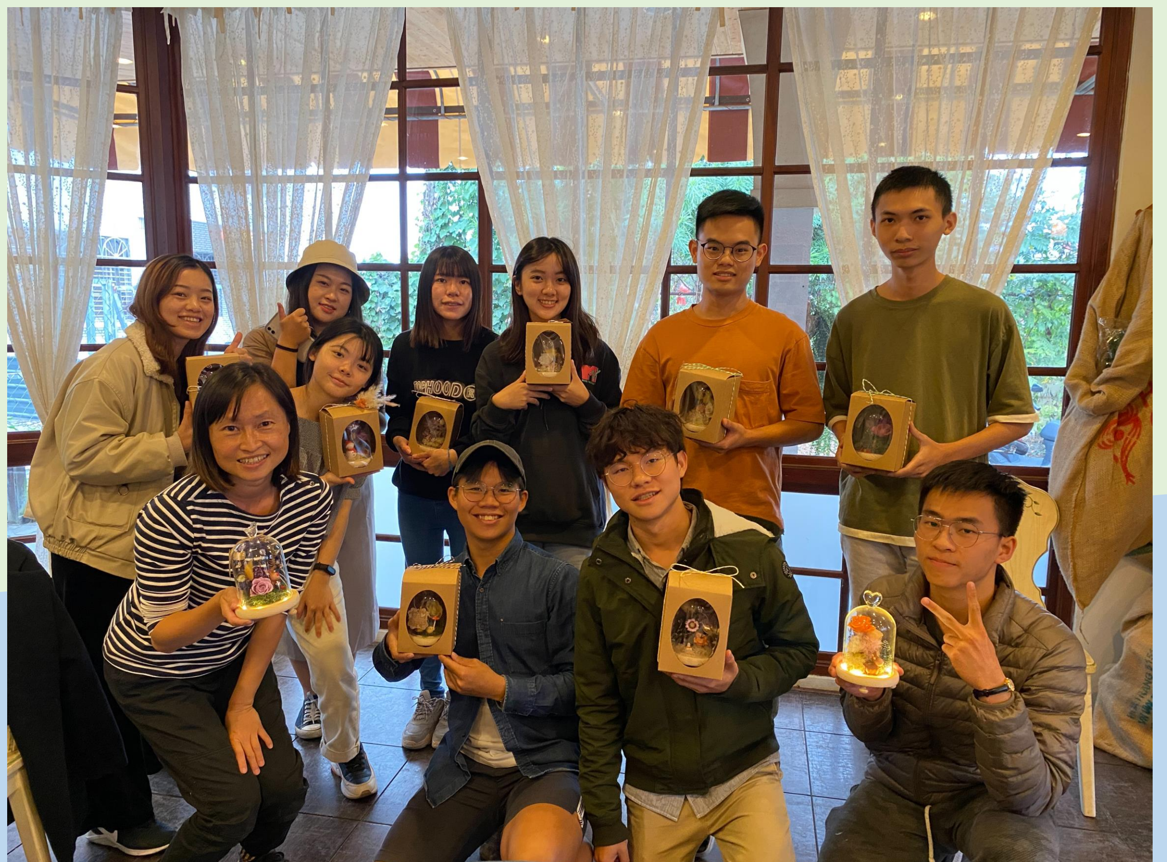
乾燥花創業體驗實作

本課程透過 自身的經驗 與 產業的觀察 讓修課的同學了解微型創業如何從進入市場的實作，展開火種的培育，期待野火燎原的一天。