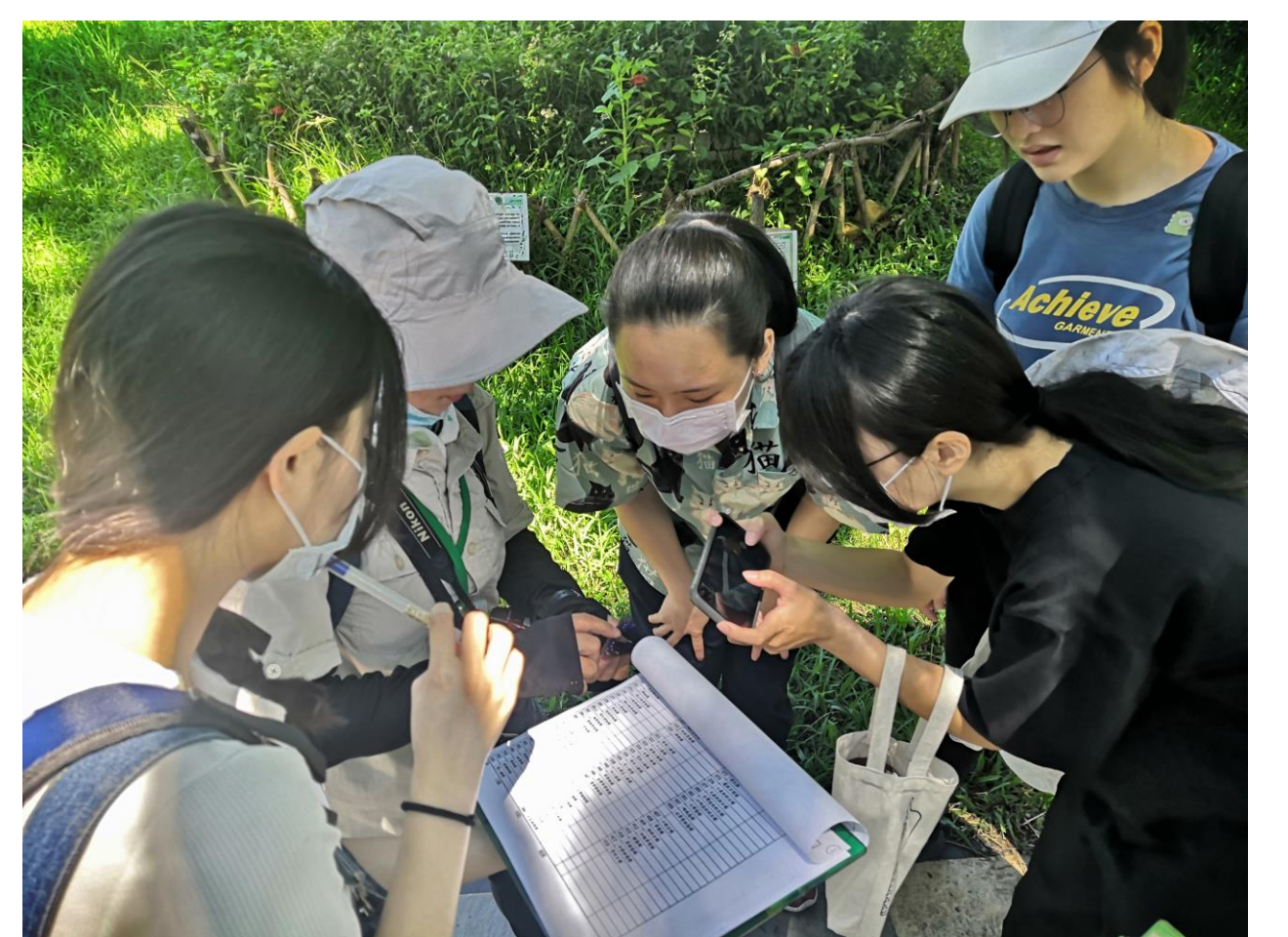
暨大後山 調查及辨識蝴蝶