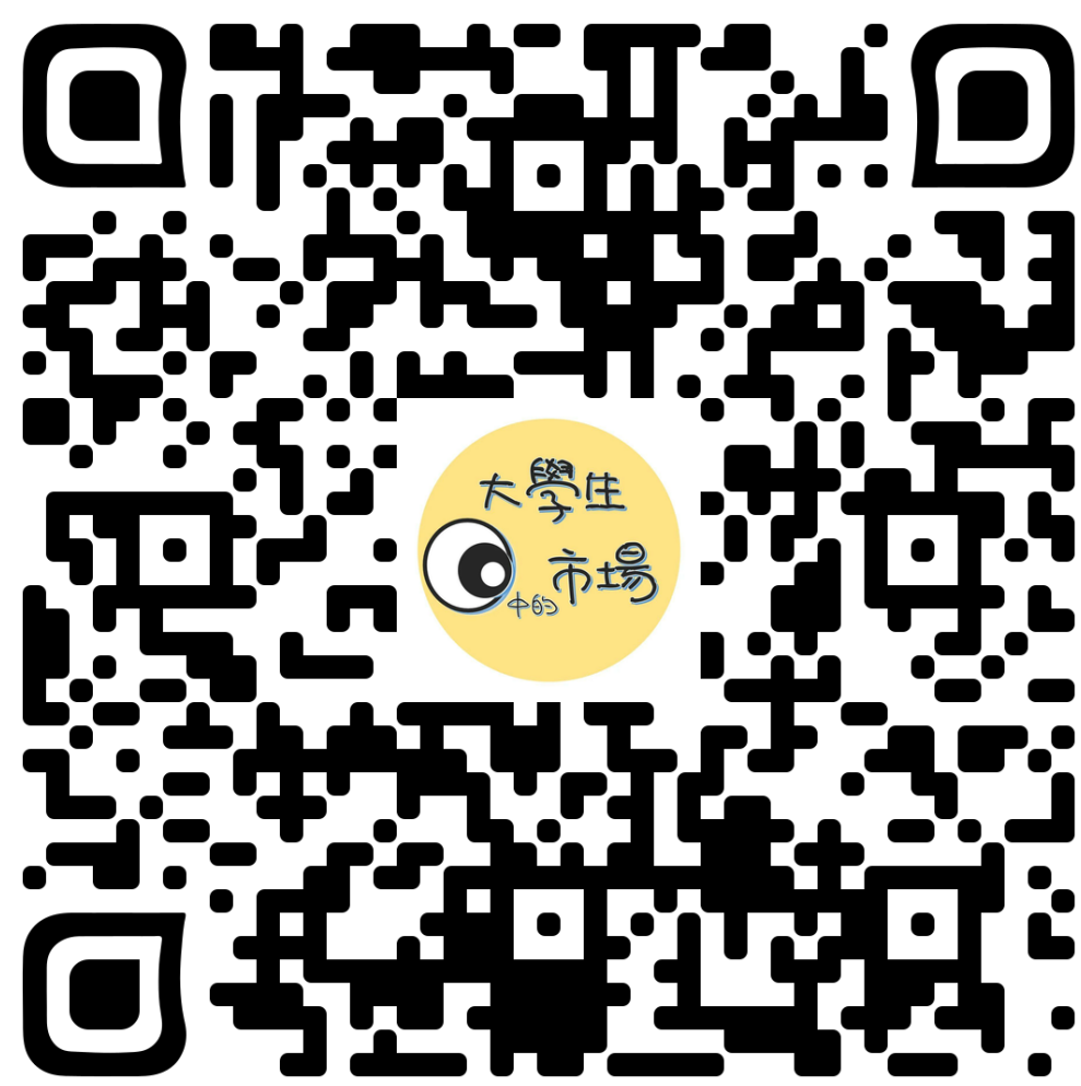
大學生眼中的市場