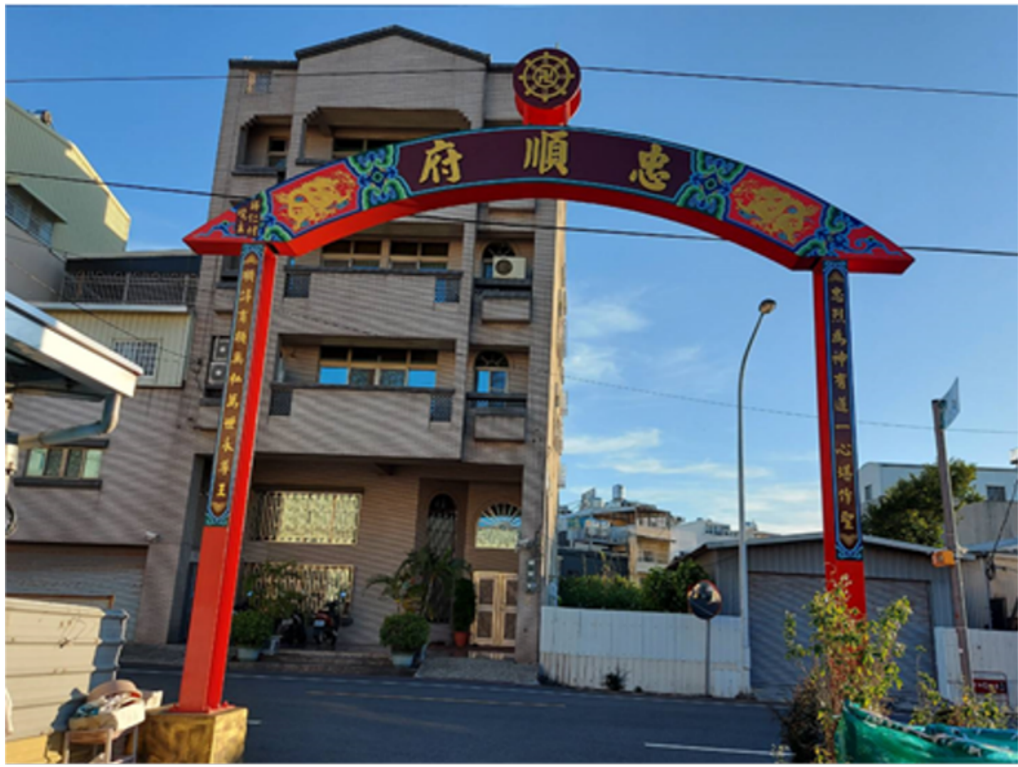
台南歸仁忠順府 宋江陣耆老採訪

透過移民社會的發展脈絡，帶領同學了解民間信仰與族群遷徙間的關係；透過社會參與式的課程進行方式，教導同學學習民間信仰的田野訪談與調查技術，並透過祭典與信仰文化的採訪過程，讓同學了解信仰文化的調查技術運用。