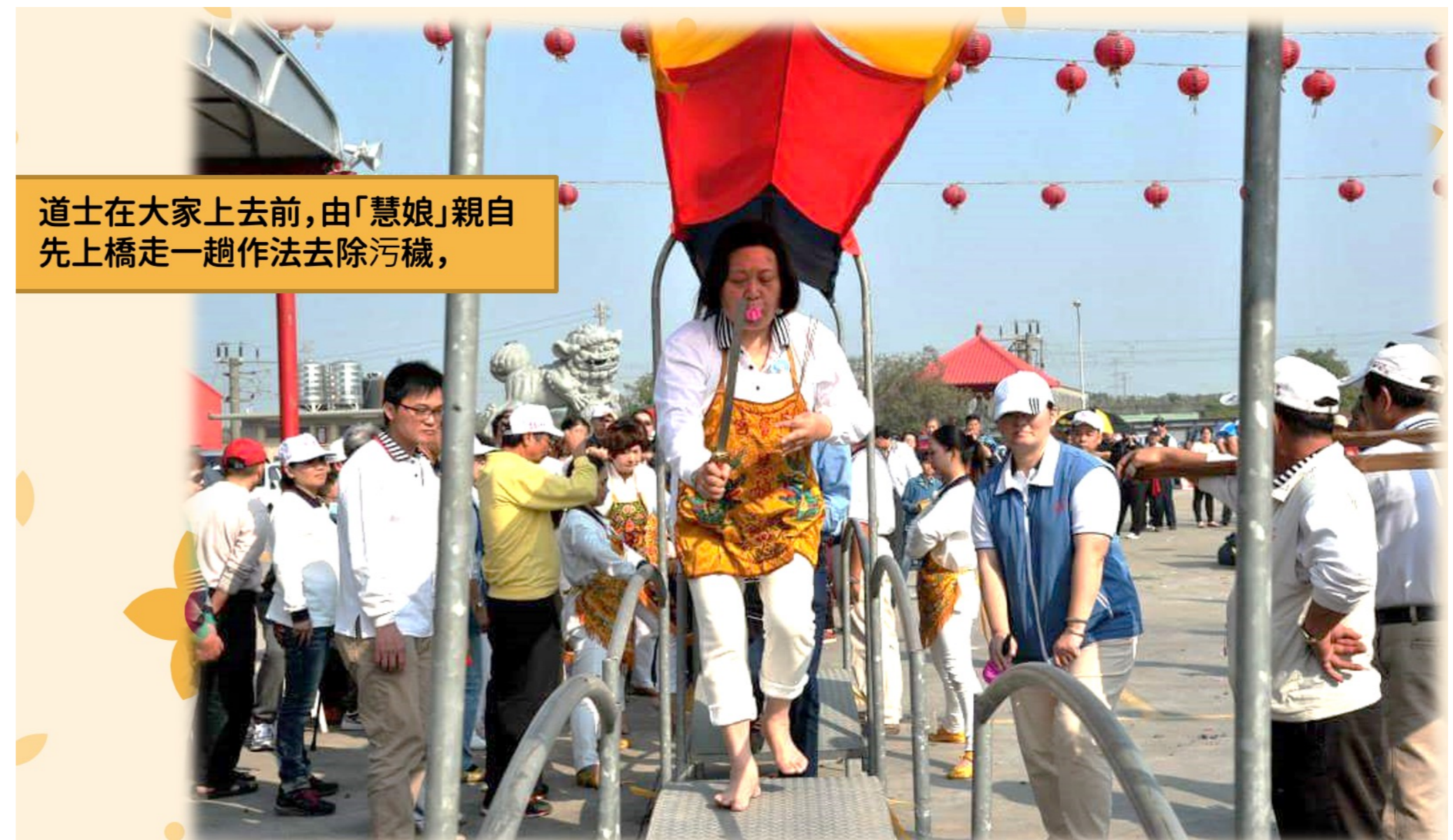
道士在大家上去前，由「慧娘」親自先上橋走一趟作法去除污穢，

上橋之前，先「燒金點香」祭拜神明，之後領取一束「解厄紙」。第一次上橋時，將解厄紙邊走邊向外拋，法師搖動法鈴，在身體上下作法一番，以求消災解厄，走第二次時，決定你是否會被擱下來。 (若神明將你擱下來，就要在過年後再到宮裡祭改(通稱補運、改運，在該儀式中請道士或法師舉行儀式，以使其運勢轉趨順遂)。